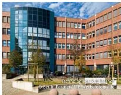
Technologiepark Adlershof