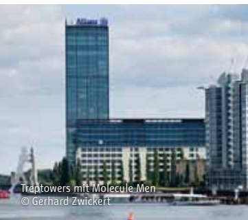
Tragtowers mit Molecule Men