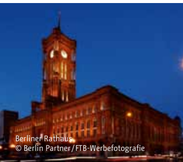
Berliner Rathaus