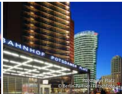
Potsdamer Platz