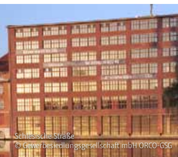
Scherische Straße