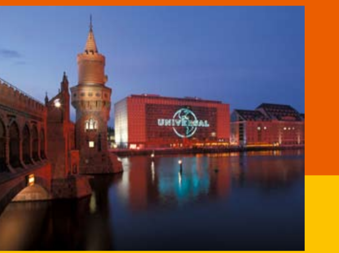
Hauptsitz von Universal Music, MTV und VIVA