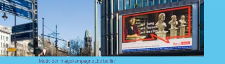
Motiv der Imagekampagne „be berlin“