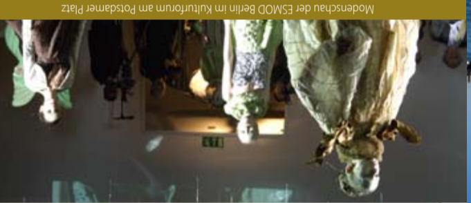
Modenschau der ESMOD Berlin im Kulturforum am Potsdamer Platz

— Trendy Clubwear kommt aus Berlin. Unerbittliche Schick von jungen Modemachern auch. Rund 800 junge Designer und Labels setzen in Berlin neue Trends. Für Nachwuchs ist gesorgt: Neun Modeschulen – die Universität der Künste, die Kunsthochschule Berlin-Weißensee, die Letzt-verein, die international ausgerichtete Modeschule Esmo und andere – bilden die Kreativen von morgen aus. Zahlreiche Messen und Branchenetzwerke ziehen ein internationales Fachpublikum, Einkäufer und Handlungsgesunden sowie große Namen der Mode nach nach Berlin. Besondere Events der Berliner Modenkultur sind die FashionWeek Berlin, die Premium Exhibition, der Walk of Fashion und das Global Fashion Festival.