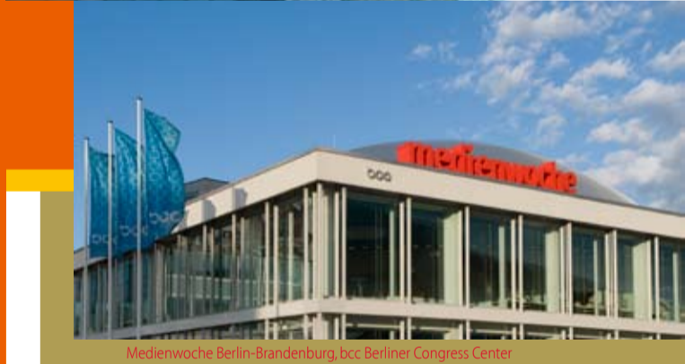
Medienwoche Berlin-Brandenburg, bcc, Berliner Congress Center