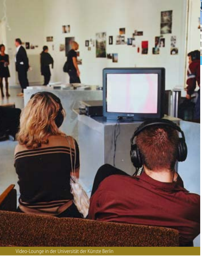
Video-Lounge in der Universität der Künste Berlin