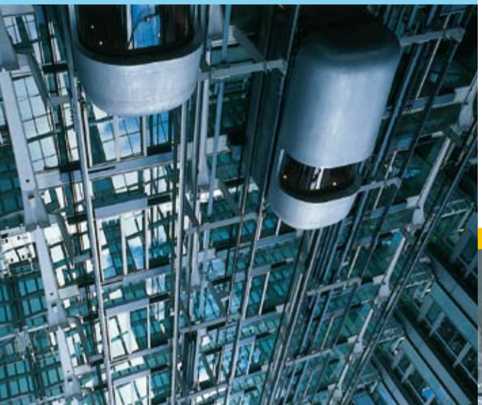
Ludwig Erhard Haus, Sitz von Berlin Partner und der Industrie- und Handelskammer

www.berlin-partner.de | www.berlin.de | www.berlin.de/berlin50 | www.berlin.de/stadtouren | www.berlin-partner.de/berlinkalender