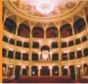
Staatsoper von Budapest Budapesti Állami Operaház