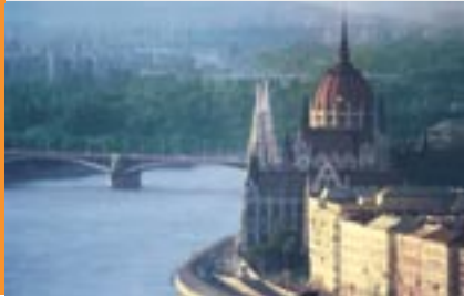
Parlament im Morgenlicht A Parlament napfelkeltekor