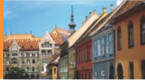
Burgviertel von Buda Budai Várnegyed